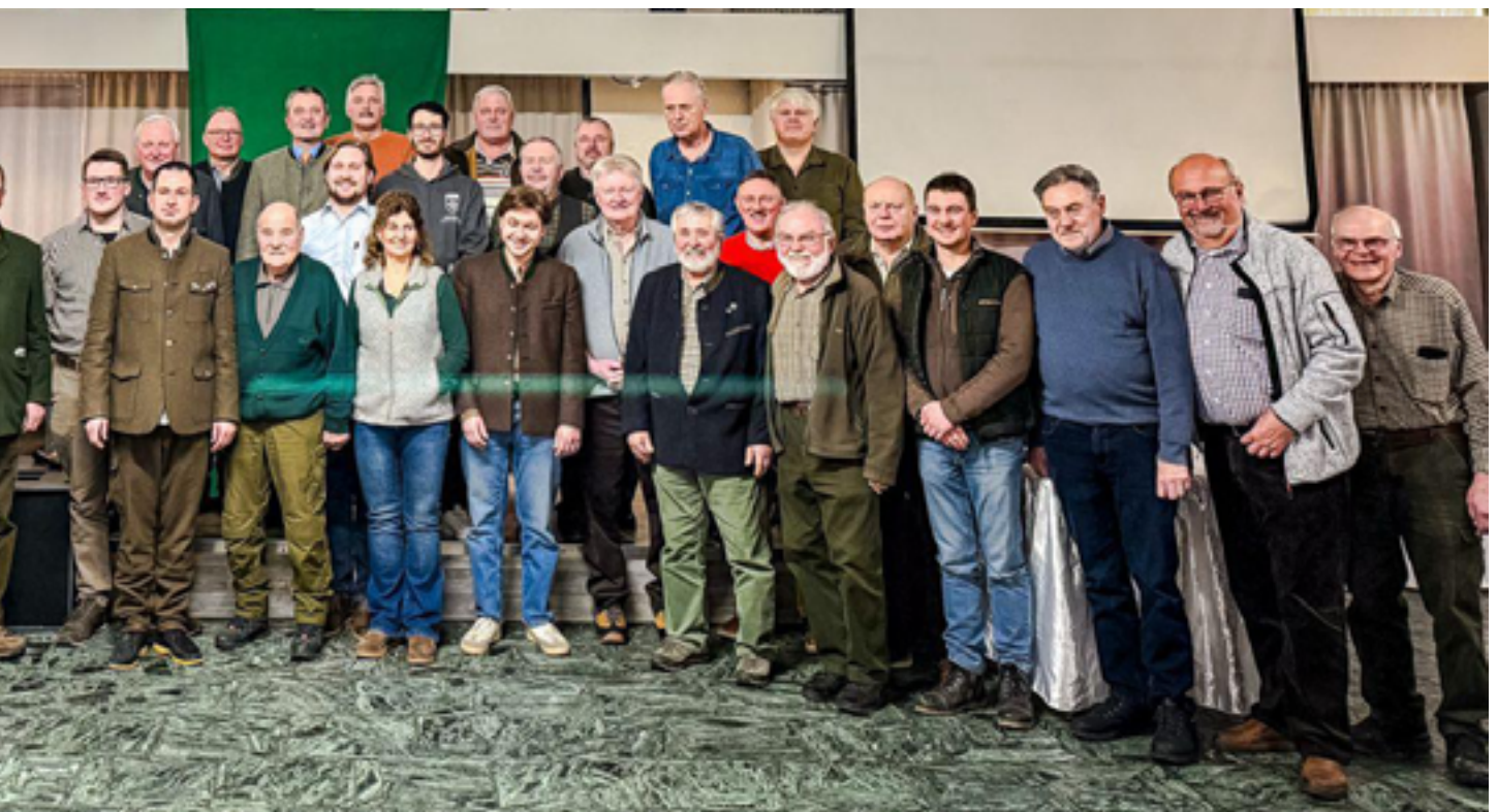
Standaufsichten von Pforzheim und Mühlacker